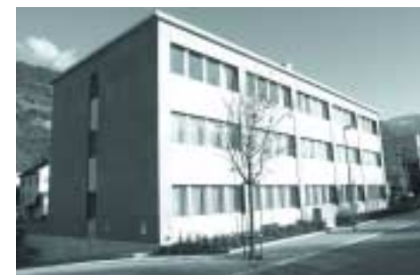
Haus Wuhr Ost